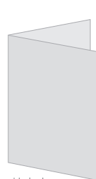
składanie na pół